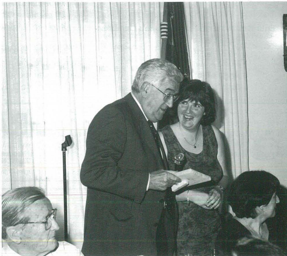
Lliurament de l'obsequi commemoratiu als representants del F. C. Barcelona.