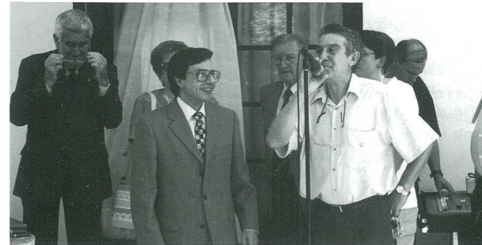
Presentació de l'acte de lliurament de premis del Concurs "Fem Barça".