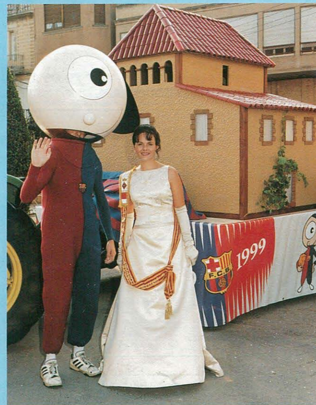
EL "CLAM", LA PUBILLA I LA CARROSSA