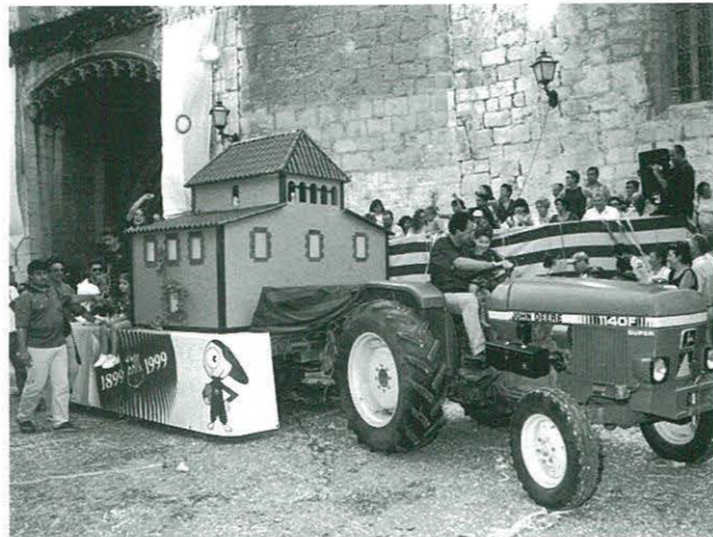
Carrossa: la Masia i l'anagrama del Centenari del F.C. Barcelona