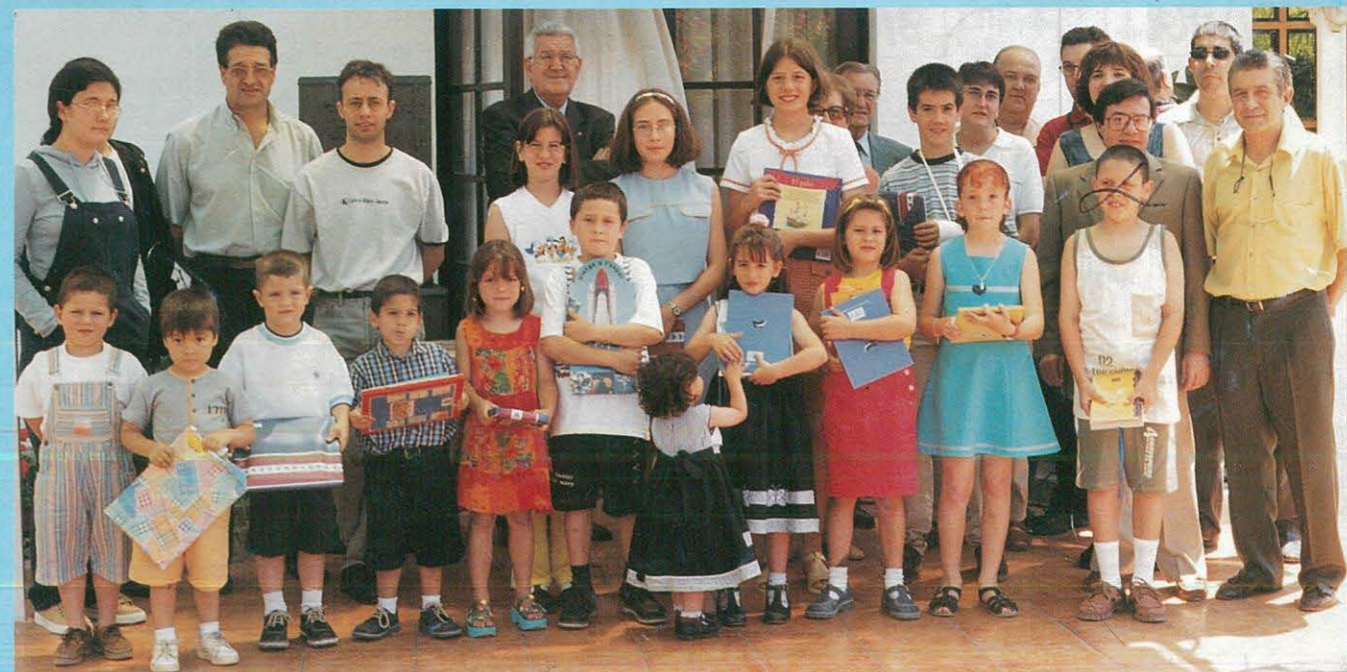
CONCURS "FEM BARÇA"