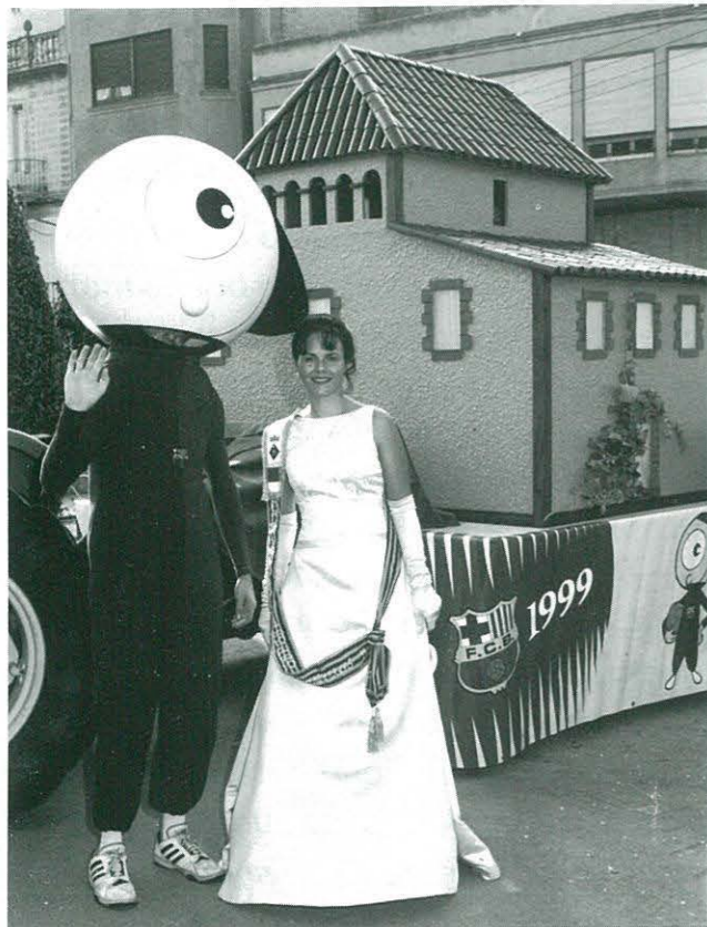
Assistència del "CLAM" que fa presència al Camp Nou durant els partits de futbol del Barça