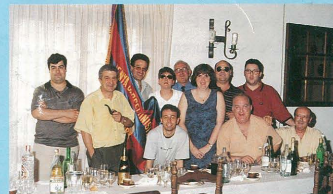
CELEBRACIÓ DEL XVII ANIVERSARI