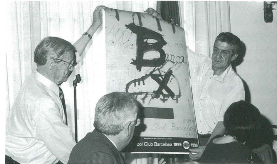
Lliurament per part del F.C. Barcelona a la Penya Barcelonista, la litografia del Centenari.