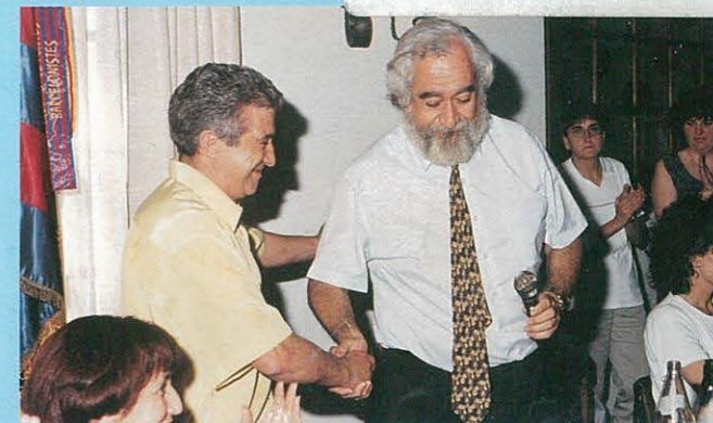
AGERMANAMENT AMB LA PENYA DE COMA-RUGA